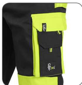
multifunkční vaková kapsa multifunctional sac pocket kieszeń wielofunkcyjna