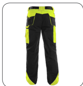
zadní strana back side z tyłu